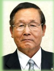
副議長 槇山 幸一