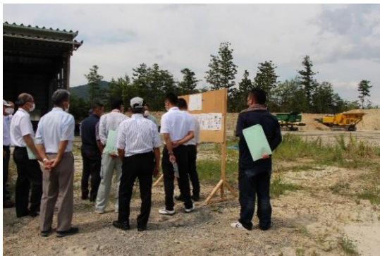
▲管内視察の様子((株)明和クリーン)

みよし広域連合議会では、令和4年8月29日に広域連合議会議員8名と職員7名が参加し、管内視察を行いました。