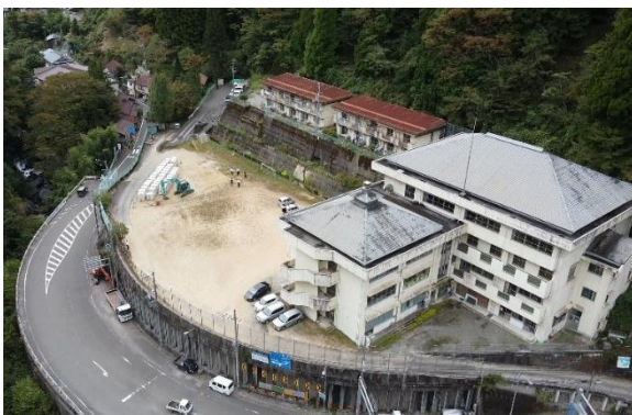
▲池田消防署祖谷分署移転先の旧栃之瀬小学校

午前中は、池田消防署祖谷分署の移転建設予定地である旧栃之瀬小学校(三好市東祖谷新居屋)の現地確認を行いました。現池田消防署祖谷分署は、地盤沈下や土砂の流入などにより、消防署また祖谷地区の防災拠点としての機能維持