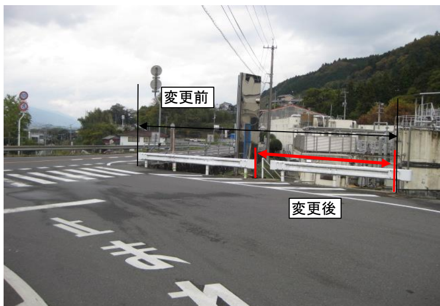
脱水汚泥搬出車等出入口