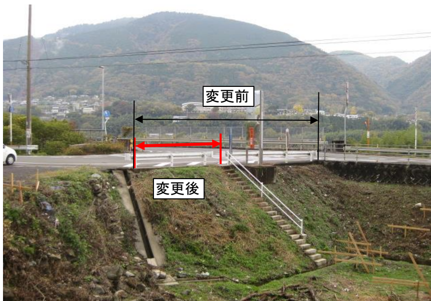
脱水汚泥搬出車等出入口